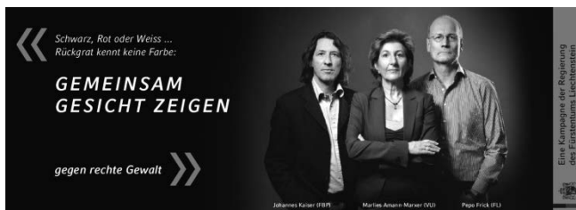
Abbildung: Eines von mehreren Sujets mit wechselnden Personen im Rahmen der Kampagne gegen rechte Gewalt 2010.

Die Ausländerinnen und Ausländer werden informell von verschiedenen Ausländervereinigungen repräsentiert. Selbstverständlich gibt es nicht für alle der rund 100 Nationalitäten, die in Liechtenstein wohnen, eine etablierte Vereinsstruktur. Aber die zahlenmässig grös-