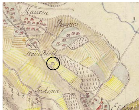
Abb. 128 | Ausschnitt mit dem Symbol für den Galgen auf Güediga in Eschen. Special Charte von dem innern Theil des Reichs Fürstenthums Lichtenstein ... des Johann Lambert Kolleffel aus dem Jahr 1756). Zürich, Zentralbibliothek.

und Fähnrichen, den eigenen Steuergenossenschaften, den separat geführten Landschaftsrechnungen und den eigenen Landsladen (Archivtruhen) und Landschaftskassen. Der herrschaftliche Besitz an Gütern und Rechten war in getrennten Urbaren verzeichnet. Das Vaduzer Oberamt hielt seine Verhörtage ausser in Vaduz auch auf Rofenberg ab, protokollierte die Gerichtssitzungen aber in einem gemeinsamen Protokollbuch – wie auch die obrigkeitlichen Rentrechnungen, nach Vaduz und Schellenberg getrennt, in einem gemeinsamen Buch geführt wurden. Schliesslich befanden sich in beiden Landschaften eigene Richtstätten: unterhalb des Meierhofs in der Grafschaft Vaduz und auf Güediga (Eschen) (Abb. 128) in der Herrschaft Schellenberg.