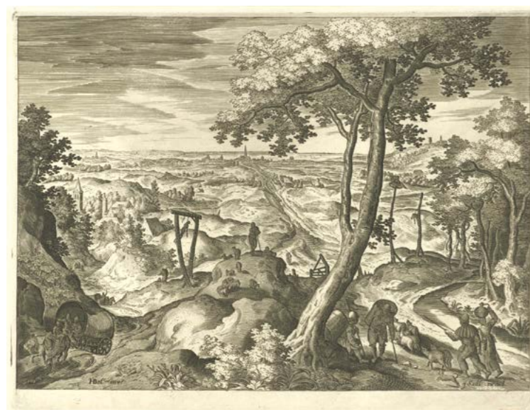
Abb. 129 | Landschaft mit einem Galgen. Stecher: Johann Sadeler (I) (1550–1600). Nach Hans Bol (1534–1593). Um 1560–1600. Kupferstich auf Papier. Amsterdam, Rijksmuseum, Inv. Nr. RP-P-OB-7508.

Warum sich die Untertanen an der Aufhebung des Stocks – einer hölzernen Fuss-, Hand- und Halsfessel bzw. des Schandpfahls oder Prangers – und des Galgens störten, begründeten sie in der Beschwerdeschrift nicht. Hätte ihnen die Beseitigung dieser herrschaftlichen Disziplinierungsmittel nicht willkommen sein können? Verständlich wird ihr Verhalten, wenn man die rechts-symbolische Bedeutung der Schand-, Marter- und Hinrichtungsinstrumente bedenkt.